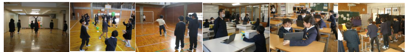
慎重に！ 繋げていこう。 シュート！ 中身は？ 答えは？ 上手く投げて。

在校生に「楽しいな。」「次が楽しみ。」と言わせた6年生。フェスティバルは、大成功でしたね。