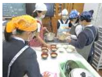
5年生家庭科(調理実習)