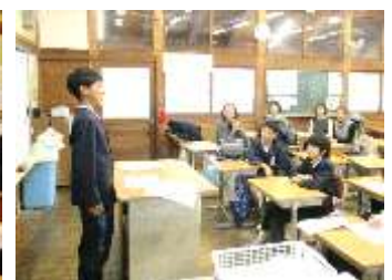
室内ゲームクラブ(語りチャレンジ)