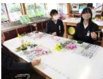
家庭科クラブ(生け花チャレンジ)