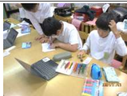
読書祭りの準備をする図書委員会

読書は人間形成に少なからず影響すると考えられます。この結果を基に、学校でも本を読む時間を確保する工夫を考えていきたいと思っています。放課後も習い事などの様々な予定がある児童が多いと思いますが、その大切さを踏まえて、今一度、読書の時間の確保をお願いしたいと考えています。