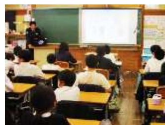
6年生(インターネットモラル教室)