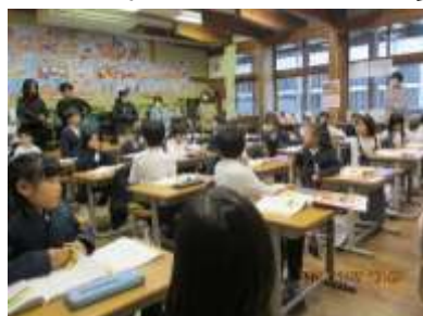
人権参観日の1年生教室