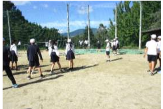
お昼休みにドッジボールで遊ぶ6年生

「主役は君だ!」とスポフェスをやり切り、その後も、角力大会や社会見学、学習発表会など、大きな行事もあった2学期です。終業式で体育館に整列している姿からは、ずいぶん成長の跡を感じることができました。保護者や地域の皆様に支えていただき、温かく見守ってくださっていることを児童自身が感じているからこそ、安心して持っている力を「自分から」「進んで」発揮させることができたのだと思います。これが子ども達の成長に大きくつながっているのだと思います。今年も学校の教育活動にご理解とご協力をいただきましたことに深く感謝いたします。