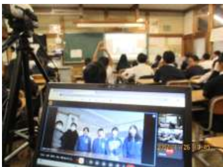
福島県高野小学校と交流する5年生

国際化の流れは、確実に進んでいます。これからも、機会を捉えて世界の様々な国にルーツを持つ方とふれあえる機会を作っていきたいと考えています。現在、インターネットで海外とつながるオンラインミーティングを計画しています。相手のあることですので上手くいけば3学期にも英語を使った交流ができるかもしれません。