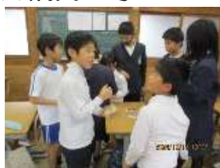
カードゲームあそぶ縦割り班