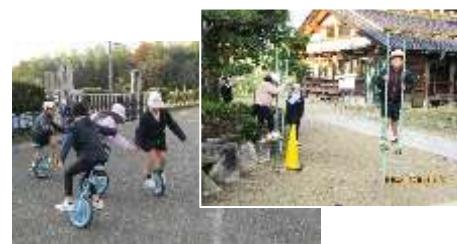
竹馬や一輪車に乗って遊ぶ児童

朝のあいさつ運動が終わる頃には、体育館前の広場に児童が一輪車に乗りに来ています。「今年、乗れるようになった。」と言う児童も毎朝のように練習しているので、とても上手に乗れるようになっていました。