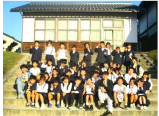
来校された3人と記念撮影する4年生

1学期には、低学年に奈義町にホームステイで来られていたお二人の外国の方が来校してくださいましたが、2学期は、4～6年生に岡山県国際交流協会を通して3人来校してくださいました。しかも、お二人は昨年が続いての2回目の来校でした。学習発表会の合奏を披露したあと、それぞれの学級で交流しました。日本とは違う文化を肌で感じることでできる機会になったのではと思います。