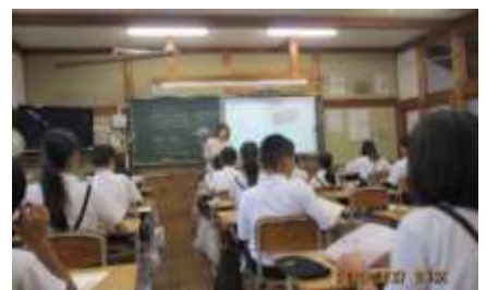
最初の配り物を確認する6年生