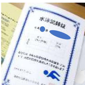
校内水泳記録会の記録証

1学期末に5・6年生が取り組んだ校内水泳記録会の記録証を渡しました。水泳の季節は短いです。来年度も、ぜひ記録を目標にして、チャレンジして行ってほしいと願っています。