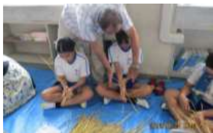
教えていただいてチャレンジ

5年生が、手刈りした稲を束ねるための「いいそ」をなう体験をしました。作り方を聞き、グループに分かれて、いいそないにチャレンジしました。それぞれのグループについてくださっていたボランティアさんのお陰で、コツを掴んでどんどんいい、目標の400本をみんなで作りました。手の平を上手く使って同時に二つの稲束によりを掛けそれをひねりながら1本にしていく様子は、さながら職人さんのようでした。大人の手よりもず