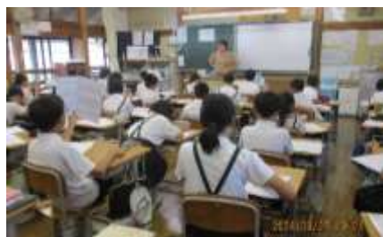
2学期取り組む音読カードを作っている5年生