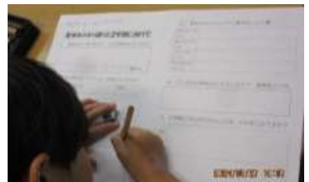
振り返りを書いている3年生