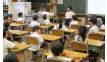
教室で思い出を発表する1年生

始業式で体育館に整列していた子ども達の姿は、4ヶ月前の1学期始業式の時に比べると背が伸びたなという印象が強かったです。そして、夏休みにおうちの人と一緒に過ごせたという満足した暮らしぶりのお陰もあって、心身ともに成長したなあと感じました。2学期は、無理をしてはいけませんが、すぐに諦めるのではなく「粘り強く頑張ろう」というお話をしました。2学期は様々な行事があります。一人一人がしっかり目標に向かって粘り強く頑張ることができれば、すばらしい行事にできるとお話ししました。行事だけでなく、様々なところで全員が活躍し、2学期の主役になってくれることを期待しています。