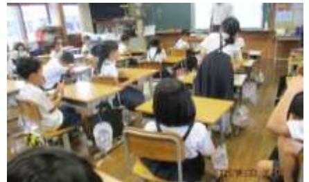
教室で思い出を発表する2年生