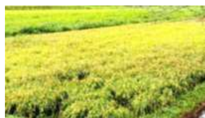
稲穂が垂れて稲刈り待ちです

5年生が、手刈りした稲を束ねるための「いいそ」をなう体験をしました。作り方を聞き、グループに分かれて、いいそないにチャレンジしました。それぞれのグループについてくださっていたボランティアさんのお陰で、コツを掴んでどんどんいい、目標の400本をみんなで作りました。手の平を上手く使って同時に二つの稲束によりを掛けそれをひねりながら1本にしていく様子は、さながら職人さんのようでした。大人の手よりもず