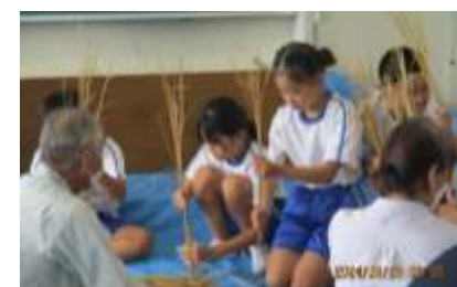
慣れてくるとつぎつぎ完成