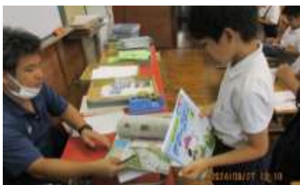
夏休みの宿題を提出する4年生