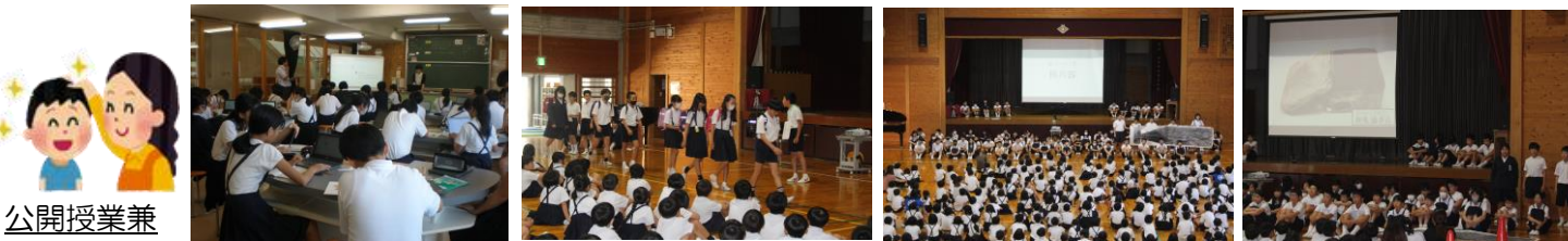
公開授業 6年生理科 植物のからだのはたらき 人権集会 生活委員会 平和集会 6年生修学旅行で学んだことの紹介

お忙しい中、朝からたくさんの参観をいただき、ありがとうございました。お子様が頑張っていたことを是非伝えてあげてください。次回の参観は、運動会になります。お楽しみに！