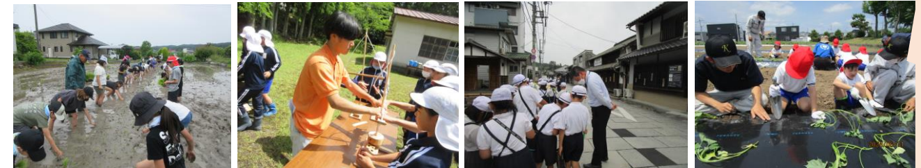
5年生 田植え 5年生火起こし体験 3年生 出雲街道探検 1年生 さつまいも植え

3年生は、6月に入り、3回のシリーズで勝央町の学習を行いました。地域の講師の方にお越しいただき、勝央町の様子や特産物、文化や産業について2回の学習を行った後、3回目には、実際出雲街道を歩きながら、勝央町のよさを学びました。出雲街道は、勝央町の誇る文化遺産です。児童たちは、この3回の学習の後、勝央町のおすすめの場所を自分でまとめ、みんなに紹介する予定です。また、3年生はこの学習を発展させ、姉妹校である静岡県小山町立足柄小学校と交流する予定です。自分で考えたり、まとめたりしたことをしっかりと発信できるように頑張ります。