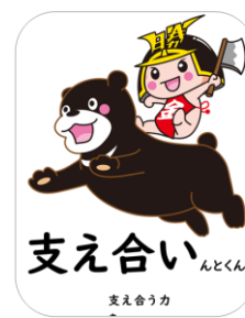
支え合い 支え合う力