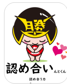
認め合い 認め合う力