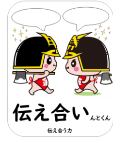
伝え合い 伝え合う力