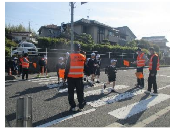
あいさつ運動に、民生委員さんも来ていただきました。