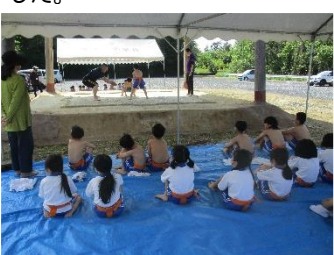
角力の練習。今年から通常の練習をしています。10月には、角力大会を予定しています。