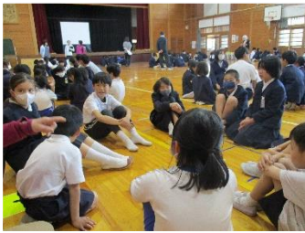
1年生を迎える会後に縦割り班の顔合わせを班ごとに行いました。