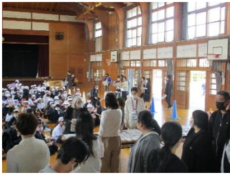
小中合同引き渡し訓練のご協力ありがとうございました。