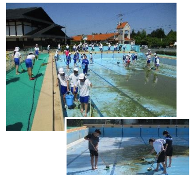
4～6年生が力を合わせて、しっかり掃除をしてくれました。放課後、飛び入りで中学生も手伝ってくれました。みんな、頼もしいです。プールもきれいになりました！