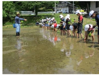
今年も5年生が田植えをしました。北小まつりのお飾りや5年生の餅つきを行っています。