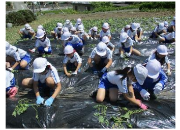
1・6年、2・4年で高学年に手伝ってもらいながら、みんなでサツマイモを植えました。