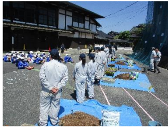
春の花いっぱい運動に、勝間田高校生が今年も来ていただきました。