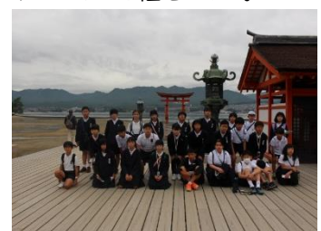
6年生が1泊2日の修学旅行へ行きました。泊を伴う修学旅行は、4年ぶりです。