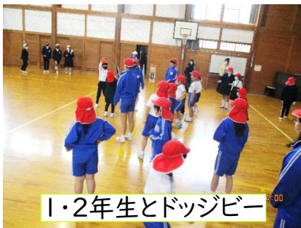
1・2年生とドッジビー

3学期に入って、6年生が在校生と一緒に楽しい思い出を作ろうと卒業プロジェクトの一つとして、それぞれの学年に応じた企画を実施してくれました。