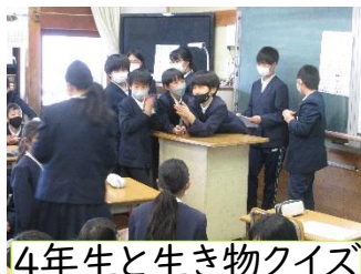
4年生と生き物クイズ