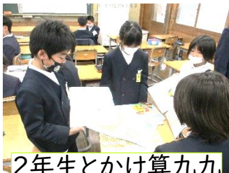
2年生とかけ算九九

えていたらシールを貼ってくれました。2年生も張り切っていました。1・2年生とはドッジボールもしました。3年生とはけいどろを、4年生には生き物クイズ、5年生は3グループに分かれての人狼ゲームをしてくれました。どの学年も6年生との思い出ができました。6年生は、学習はもちろん、卒業に向けた準備などなかなか忙しいスケジュールの中で、これまでには無かった初めての企画に取り組んでくれました。この他にも、各学級用本棚を絵で飾る計画もあります。本により親しみやすくなる雰囲気作りに役立つのではと期待しています。卒業に向けていろいろなプロジェクトを自分たちで計画し、すすめていく6年生の姿はしっかり下学年の手本です。ありがとうございます。