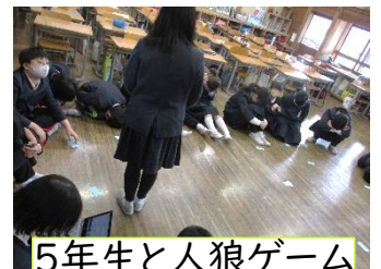
5年生と人狼ゲーム