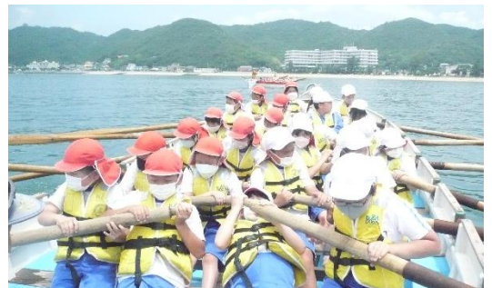
力を合わせたカッターこぎ

きっと、力を合わせたり、気持ちをそろえたりすることの大切さを経験できたのではないかと思います。来年度は勝央北小のリーダーです。この機会を生かし、意識しながら学校生活を送ってほしいと願っています。