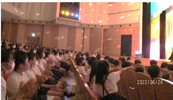
素晴らしかった芸術鑑賞会

勝央文化ホールで、午前と午後に分け全校児童が素晴らしい劇「ハックルベリー・フィン」を鑑賞することができました。関係各位への感謝の念で一杯になりました。