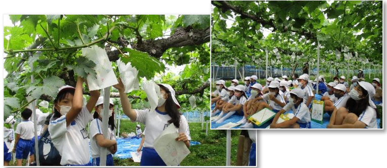
ブドウの木の下で説明を聞き、実際に紙袋かけを体験

今年も4年生がアリさんのブドウ畑の見学をさせていただいています。秋にかけて何度か訪問してブドウがなるまでとそのお世話を学習させていただいています。子どもたちの日常には無い体験ができ、楽しく学ぶことができています。