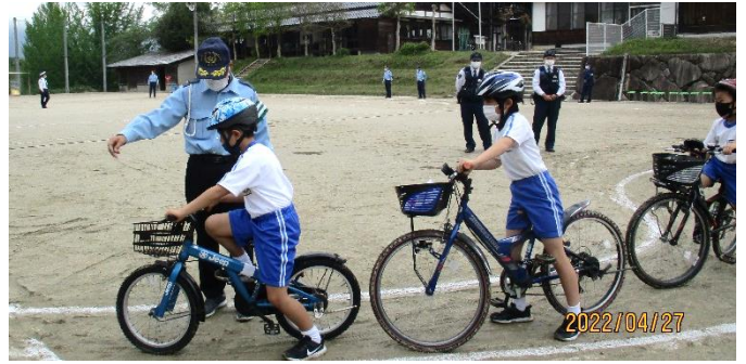
交通安全教室で自転車コースを行く3年生