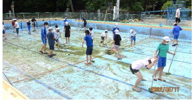
プール掃除 (写真は6年生)