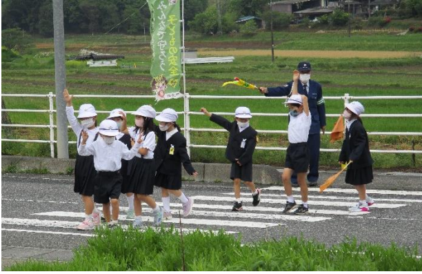
交通安全教室で横断歩道を渡る1年生