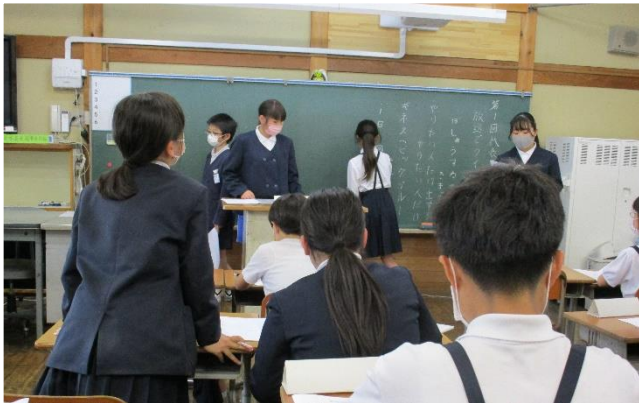
代表委員会での質疑