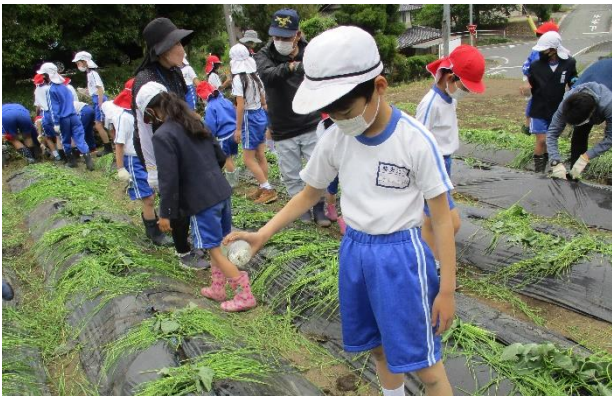
さつまいも植え (写真は2・4年生)