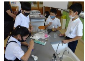
科学・工作クラブ