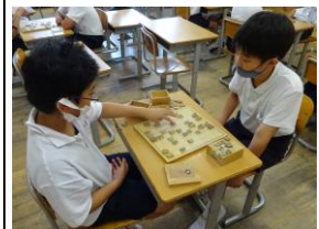
囲碁・将棋クラブ