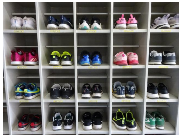
掃除後の1年生の靴箱のようす(5/18)

各ご家庭におかれましても、玄関で脱いだ靴をきちんと揃えてからあがるなど、「はきものをそろえる」ことの習慣化に向けて、ぜひとも声掛け等を行っていただけたらと思います。どうぞよろしくお願いいたします。