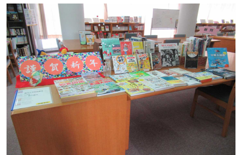
図書室の新刊コーナー