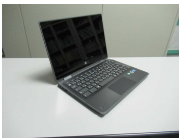
生徒が使用予定の端末

「グーグルアカウント」へのログインとパスワード設定がまだのご家庭はぜひ、お早めをお願いします。