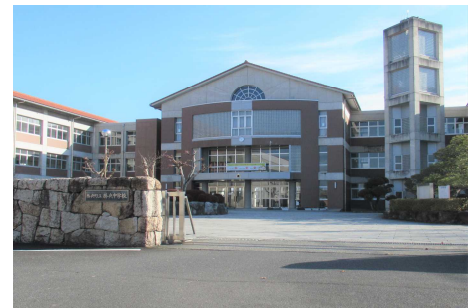
きれいに整備された校舎外回り