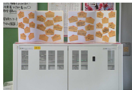
3年生への応援メッセージ