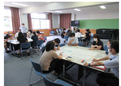
9/2 校内研修「めざす姿と取組」