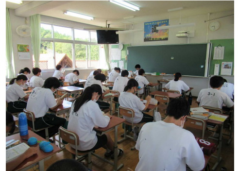
静かに集中！全校朝読書