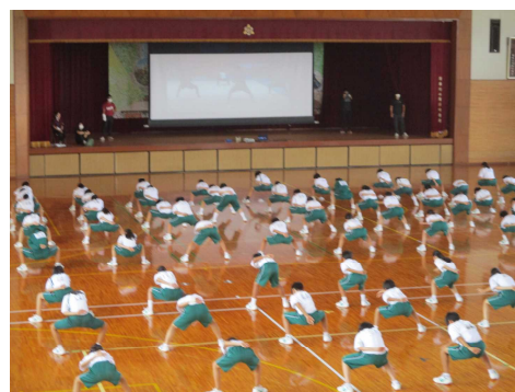
1年生練習(ソーラン)