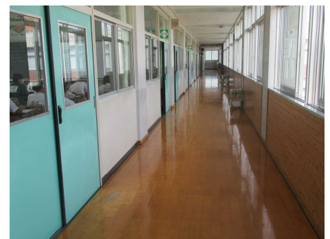
ピカピカの2年廊下(他学年も同じです)